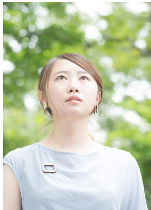
森を感じる心地よさ、森を身につけるしあわせ

Wàku【わく】はブローチとピアス(又はイヤリング)のセット。それぞれの組み合わせは原木を製材するときの「木取り」の作業からインスピレーションを受けてできたもの。地域の木を余すことなく活かすことにも繋がっています。