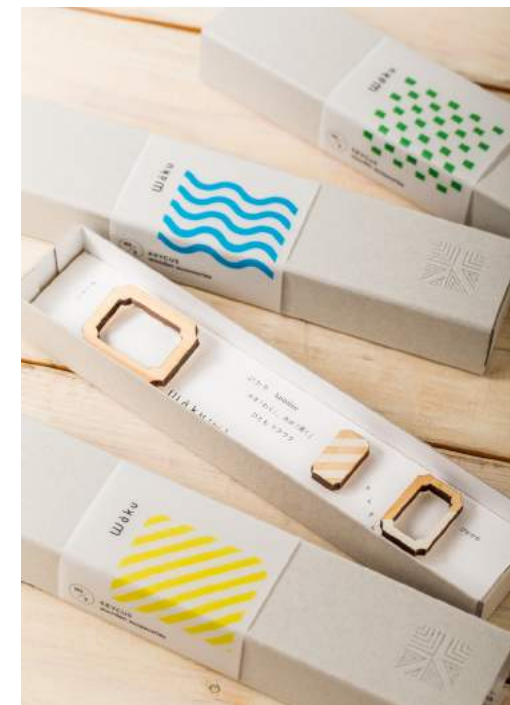
森を感じる、「ひかり」・「みず」・「木」3種のデザイン

森に差し込むこもれび コンコンと湧きいずる山の贈り物、 木々は生き物の命をつなぎ、 カタチをかえて 私たちの暮らしの中に