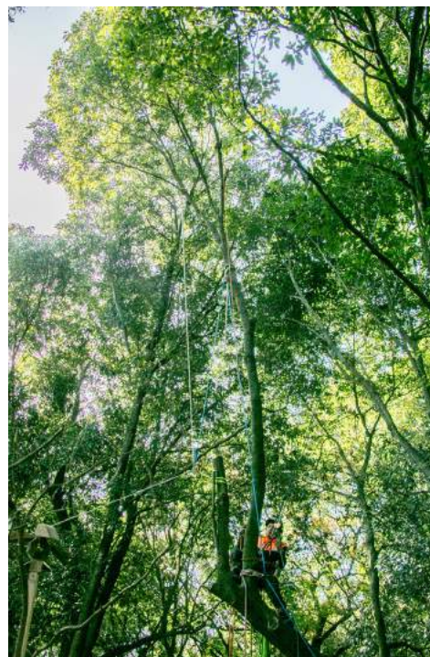
熊本の山師（林業者）が中心となり、地域のクリエイター と連携し動き始めた KEYCUS プロジェクト

木を伐るひと、商品の製作に関わるひと、 それを使うひと、興味を持ったひとが 「山づくり」や「豊かな暮らし」を考える KEY(きっかけ)になることを願います。