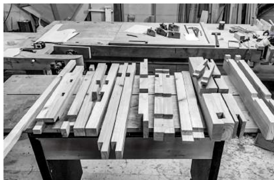
地域材を活かし、屋外での使用を考えた接合方法でつくられています