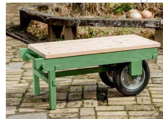
仲間とくつろぐベンチ、テーブルにも。可動式で便利です