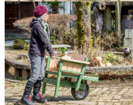
ネコチェアの「ネコ」は一輪車の呼び名（ネコ車）から 女性でも移動はカンタン、お気に入りの場所へゴロゴロ